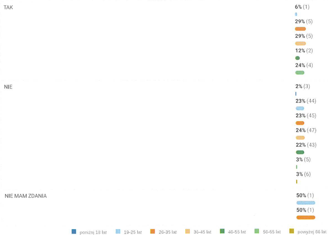
Wykres 2. Liczba głosów ze względu na Wiek